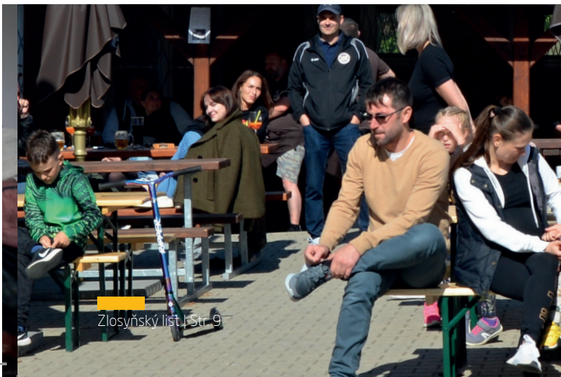
Zlosyňský list, Str. 9