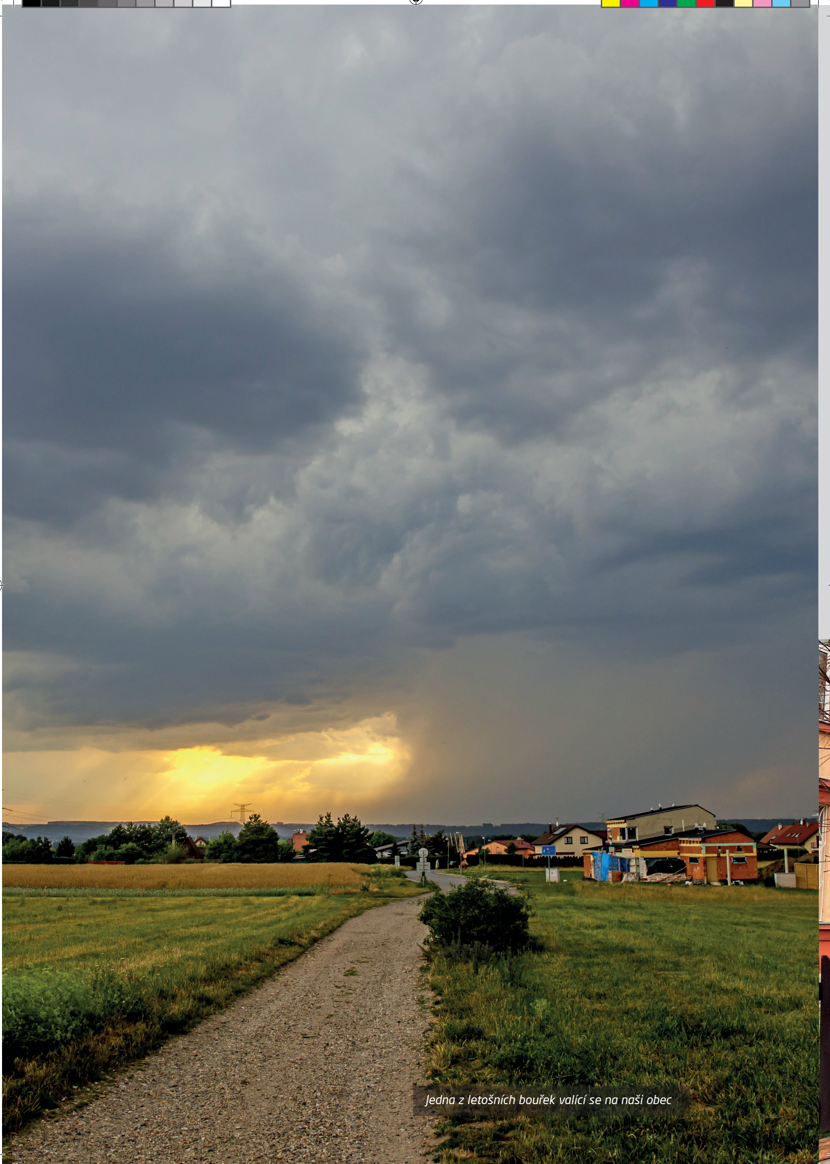
Jedna z letošních bouřek valící se na naši obec