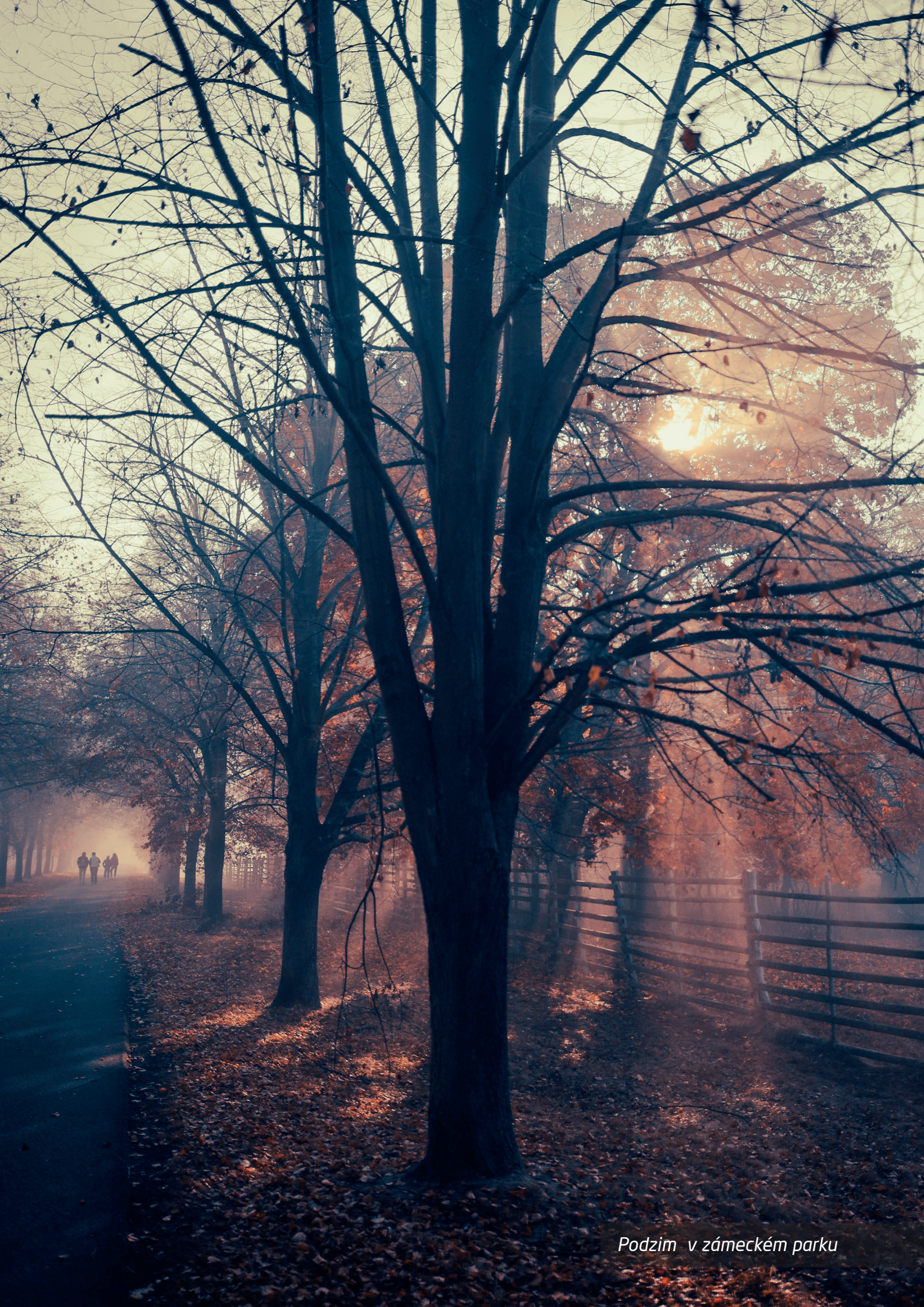
Podzim v zámeckém parku