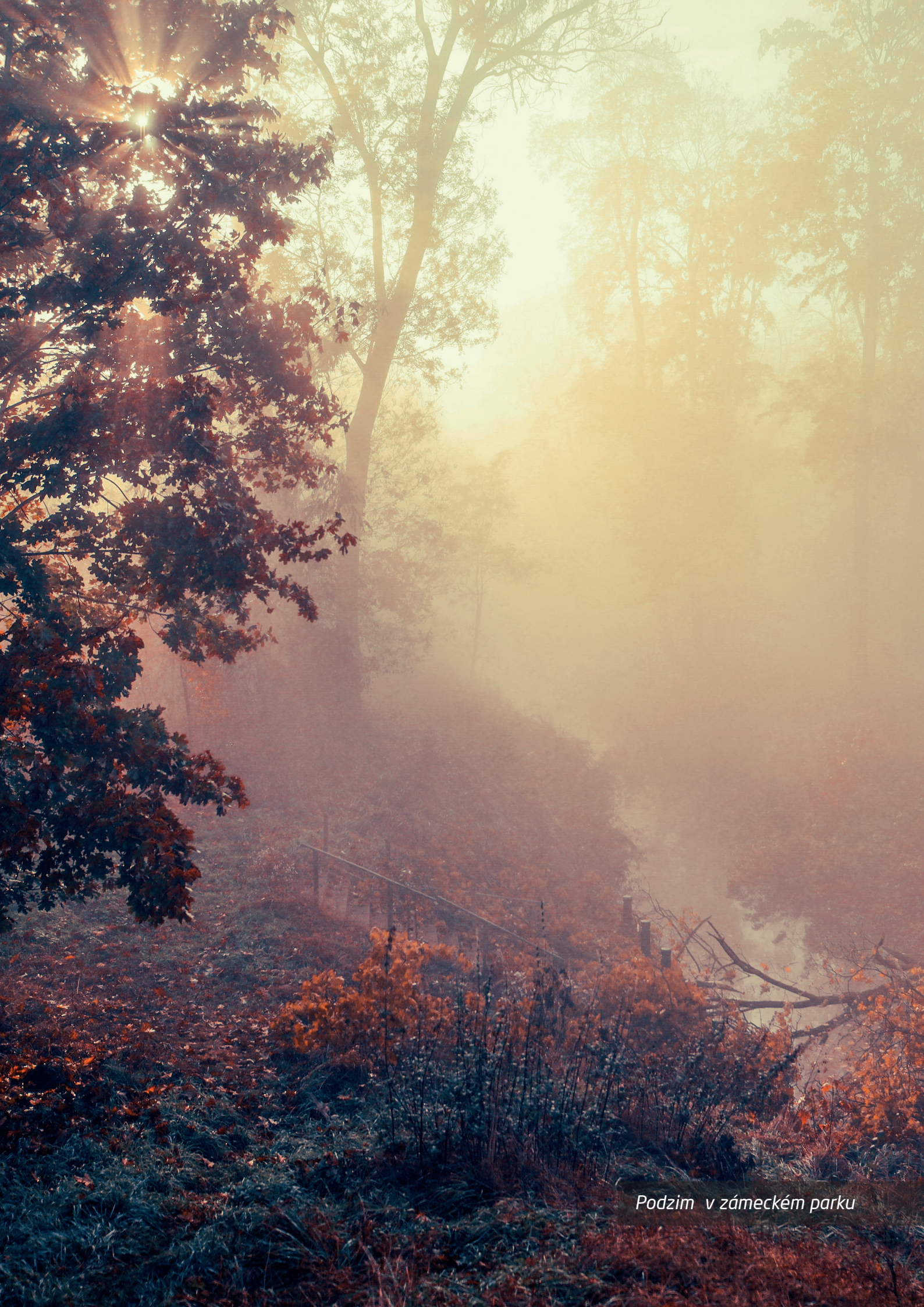
Podzim v zámeckém parku